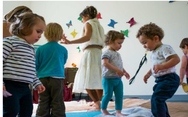
Photographies réalisées à la crèche "premiers pas" à Lille.